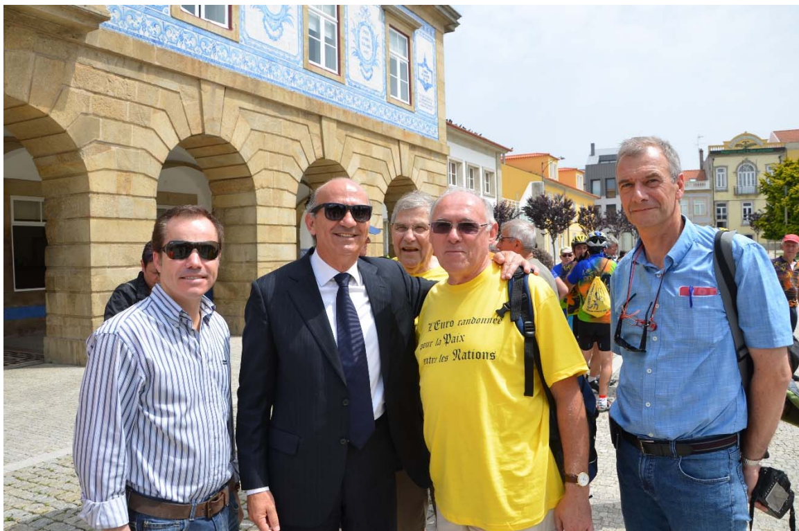
Povo de Varzin, juin 2012 lors de Porto – Gijón

Nous sommes heureux et fiers d'être à MONTGERON et, d'autant plus que nous avons reçu un accueil fabuleux à POVOA DE VARZIM, ville portugaise jumelée avec MONTGERON. J'en conserve un souvenir ému.